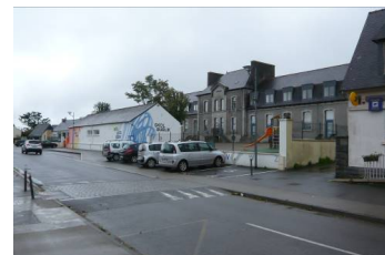
École publique Jules Ferry et Poste