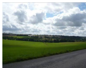
Vue en direction de Kerdoncuff