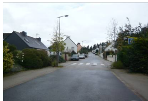
Rue du Justicou