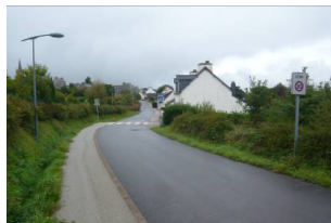
Rue de la libération