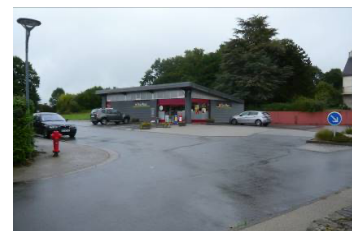
Commerce – superette