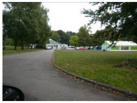
Pont-Pierre, Centre de vacances au Sud du bourg