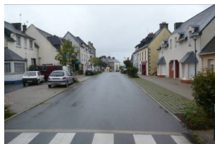
Stationnement perméable RD769