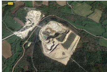
Carrière du Goasq