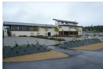
Complexe sportif, touristique et associatif