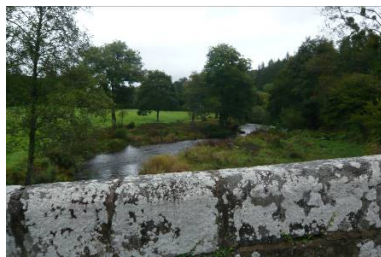
Pont Ar Gorret