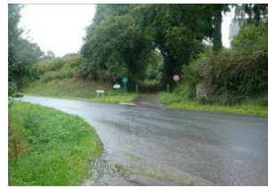
Voie verte au Sud du bourg