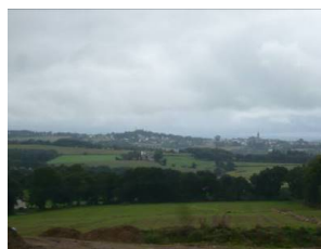
Vue en direction du bourg