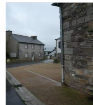
Stabilisé au centre bourg