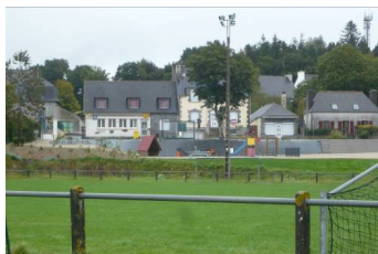
Stade et aire de jeux

En vue de permettre aux différentes catégories d'utilisateurs d'accéder à des services de communications électroniques performants, il convient d'assurer la cohérence des infrastructures de communication électroniques en fonction des options d'aménagement retenues au niveau régional.