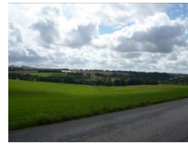
Paysages des Monts d'Arrée