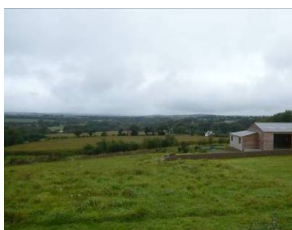
Vue lointaine en direction de Beffou