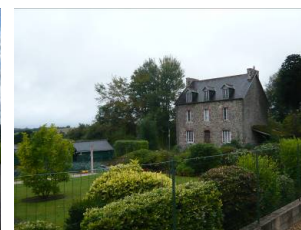
Part du jardin au sein des constructions